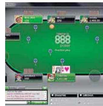
El juego 'online' atrae a muchos jóvenes.

Lo anunció el ministro de Consumo, Alberto Garzón, en la clausura del acto para la presentación del Fichero Eficaz, un proyecto, que pretende ser una realidad a finales de este año, para impedir a los jugadores que lo soliciten voluntariamente acceder a los denominados "créditos rápidos" para seguir jugando.