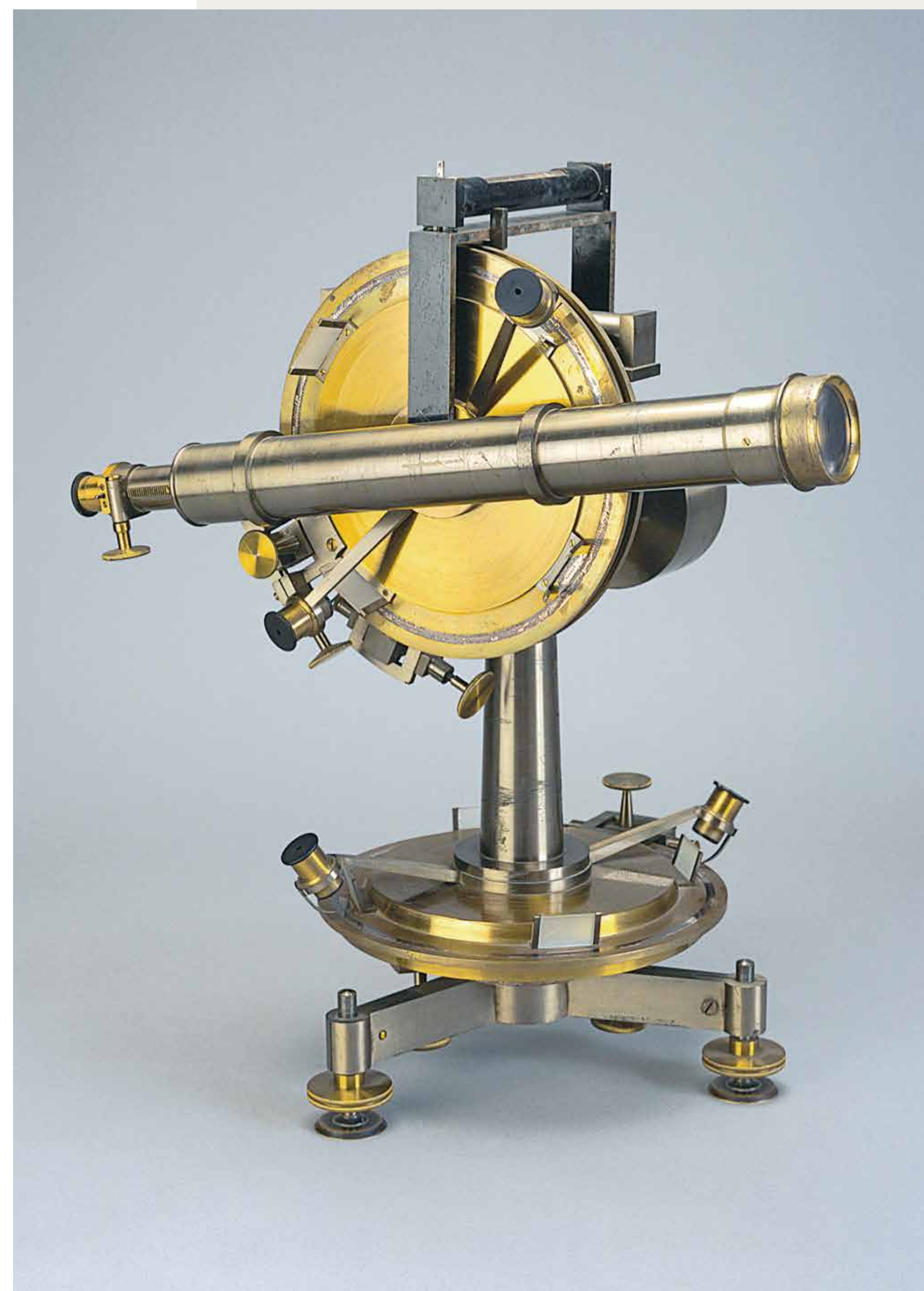
Teodolito de Brunner, Francia, 1860, Museo de Instrumentos del Instituto Geográfico Nacional. Uso: mediciones de ángulos y distancias.

El crecimiento que experimentaban las ciudades españolas desde mediados del siglo XIX obligó a proyectar remodelaciones urbanísticas y numerosos ayuntamientos encargaron la formación de planos que permitieran tener un buen conocimiento de la morfología urbana y que sirvieran de base para planificar dichas reformas. En 1878, Dionisio Casañal, que atesoraba una sólida formación topográfico-cartográfica y una notable experiencia profesional,