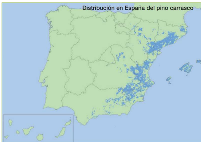
Figura 5. Distribución de la especie Pinus halepensis en España. Fuente: Prada, A. 2008. Guía técnica para la conservación genética y utilización del pino carrasco ( Pinus halepensis ) en España. Foresta. Madrid.

Según Herranz (2000), en la Península Ibérica las zonas más áridas de su área reciben entre 250-350 mm anuales (Valle central del Ebro, sureste, algunas Sierras Béticas), en la mayor parte de su territorio entre 350-500 mm anuales, y en determinados enclaves de la parte oriental de Cataluña y de la Sierra de Cazorla se pueden superar los 700 mm, dando lugar a las mejores masas españolas de pino carrasco. Blanco et al. (1997) insisten en el hecho de que es la especie arbórea mejor adaptada a la sequía, llegando a soportar 150 mm, como sucede en la sierra de Cartagena, donde convive con la población relictica de Tetraclinis articulata , no siendo la precipitación un factor determinante en su distribución.