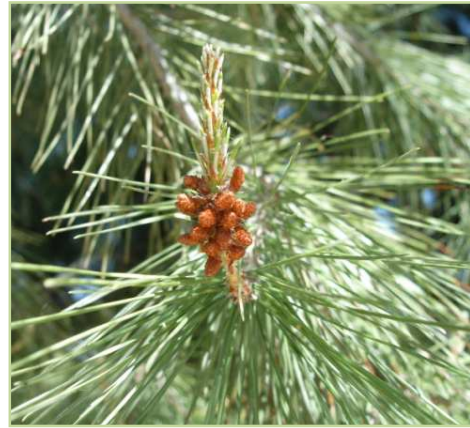
Figura 3. Detalle flor masculina de pino carrasco.

Árbol mediano que alcanza los 22 metros de altura en buenas condiciones, estando influenciados la talla y el porte por las condiciones adversas en las que habitualmente vegeta. Su corteza es blanquecina, cenicienta o plateada en los árboles jóvenes y en las ramas, tomando coloración oscura más tarde, sobre todo en la base del tronco. La copa, primero globosa-apuntada o piramidal, se extiende y abre hacia los 20 años, tomando un contorno lobulado, sinuoso e irregular, y es siempre clara y luminosa debido a la escasa persistencia del follaje. Las ramas son delgadas y muy alargadas, horizontales las inferiores y las restantes erecto-patentes. Los ramillos son generalmente uninodales, aunque en climas suaves son frecuentes los multinodales, con metidas en primavera y en otoño. Las yemas son cilíndrico-redondeadas, no resinosas, recubiertas de escamas pardo-rojizas, con pestañas blancas en las márgenes. Las acículas son finas y flexibles, de color verde claro, de 6-12 cm de longitud, aguzadas en el ápice pero no punzantes, siendo las más blandas y delgadas de los pinos peninsulares. Aparecen normalmente envainadas por dos, excepcionalmente por tres o cinco, y agolpadas densamente en el extremo de los ramillos, persistiendo en el árbol poco más de dos años, siendo las de menor duración entre los pinos españoles.