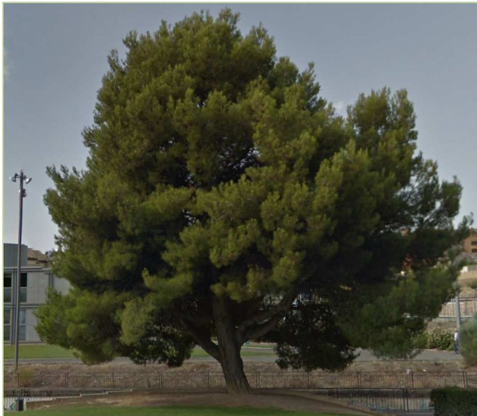
Figura 1. Detalle del árbol singular de la especie Pinus halepensis Mill. situado en el Parque del Isuela.