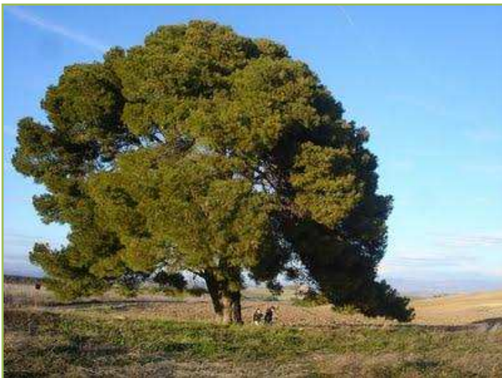
Figura 2. Pino Carrasco de Gurrea de Gallego, Catalogado también como árbol singular de la provincia de Huesca.

Generalmente, los pinos tienen una gran importancia ecológica porque ocupan ecosistemas en donde otras plantas más evolucionadas no se han podido adaptar. La función prioritaria de las masas de pino carrasco ( Pinus halepensis ), tanto en el valle del Ebro como en la provincia de Huesca es la protección del suelo y/o la restauración de la cubierta forestal, debido a que la frugalidad de esta especie le permite vivir en condiciones de clima y suelo donde prácticamente no se encuentra ninguna otra especie arbórea. Sin embargo, también es muy importante el valor social que estas masas brindan a la sociedad (paisaje, recreo, etc.). Además, la obtención de productos tangibles (madera, setas, etc.) en las masas de esta especie no es desdeñable, y en ocasiones es importante, aunque siempre se encuentra supeditada a las utilidades ambientales y sociales.