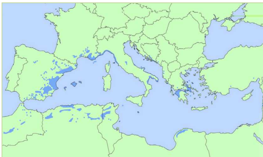
Figura 4. Distribución de la especie en el Paleártico occidental.

Los pinares de pino carrasco ocupan una banda altitudinal muy amplia, ya que el gradiente latitudinal también lo es (32º-46º), apareciendo desde el nivel del mar hasta, de forma marginal, los 1.600 m en el Atlas sahariano y en las montañas del sur de España. Dentro de este rango ocupa principalmente las zonas basales xerotérmicas y de altitudes medias, con un óptimo de distribución por debajo de los 800 m de altitud (Blanco et al. , 1997).