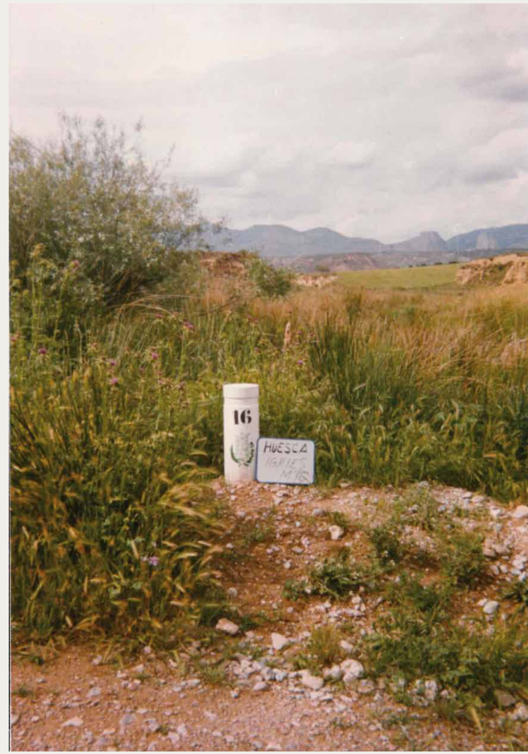
Mojón nº 16 que delimita los términos de Huesca e Igríes.