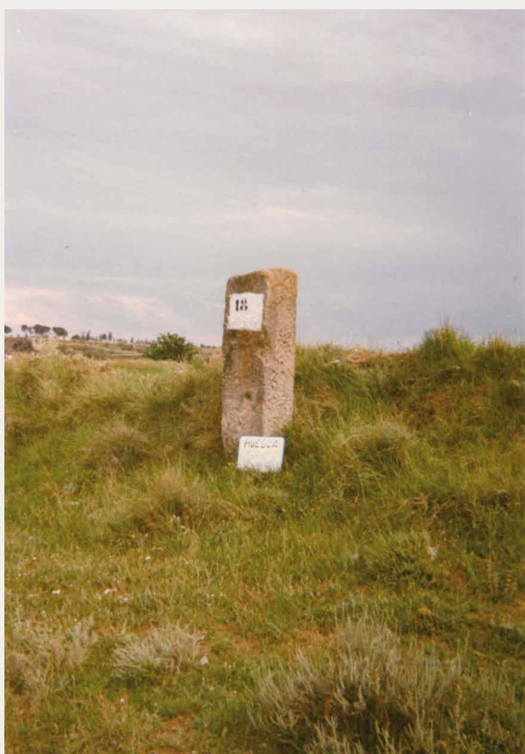
Mojón nº 18 que delimita los términos de Huesca e Igríes. Fotografía: Instituto Geográfico Nacional