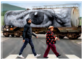
Visages villages (Caras y lugares)