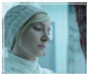
En cuerpo y alma

Martes 20.- "En cuerpo y alma" de Enyedi Ildikó.